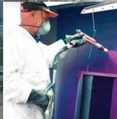
Verniciatura a polvere

Oltre alla zincatura a caldo offriamo i servizi di: